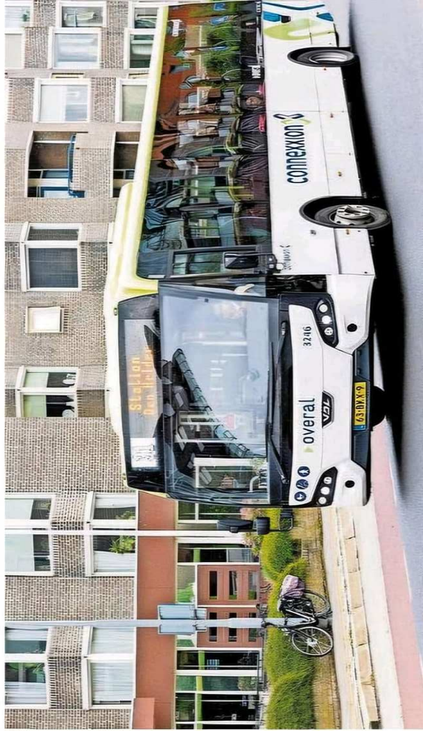
De bus stopt straks niet meer voor de deur bij zorgcentrum Ten Anker.

missie besprak de nieuwe regeling die op 21 juli ingaat. dienstregeling is ontworpen na ng van alle reizigersinfor- n een aantal vervoersmaat- n. Hoewel het beter is af- op het reisgedrag van een ep reizigers, vallen sommi- ers buiten de boot. Bijvoor-